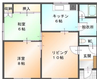
貸家 同間取り 全3戸