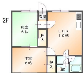
アパート 同間取り 全8戸